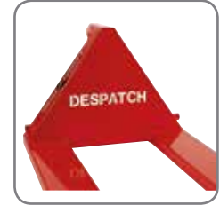
El nombre o el logotipo de la empresa pueden colocarse en el triángulo de la Panther.