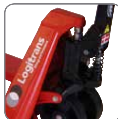
Elevación rápida permanente.