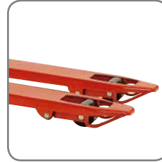
Las ruedas de las horquillas aseguran la inserción sencilla de las horquillas y el acceso y la retirada de palés.