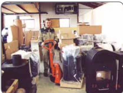
La manipulación sencilla de los productos está garantizada incluso en los espacios más angostos.