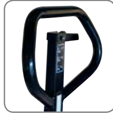
El timón ergonómico garantiza al usuario un agarre relajado. Puede marcarse con el nombre o el departamento.