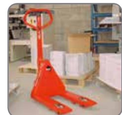
La Panther está disponible con diferentes longitudes de horquillas.

También ofrecemos soluciones hechas a medida.