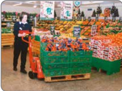
Altura de horquillas regulable: sin problema alguno al manipular palés bajos y desgastados.

También hay disponibles transpaletas de acero inoxidable en versión anti-deflagrante.