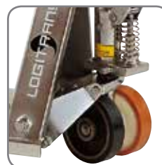
Diferentes tipos de ruedas para dar respuesta a las necesidades del usuario.