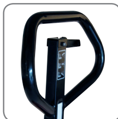
Timón ergonómico asegurando al operario un manejo cómodo.