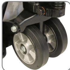
Llantas de especiales de Goma, óptimas para el cuidado de los pisos.