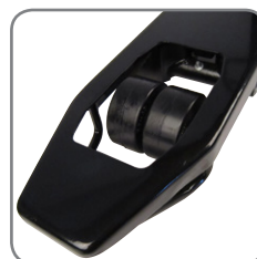
Con las ruedas de carga gemelas es muy fácil cambiar de dirección.