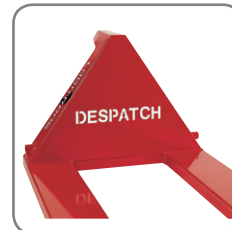
Puede personalizar la carretilla con el nombre/logo/texto y/o en el Color de su empresa.