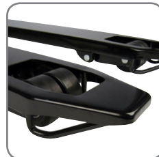
Incorporan patines para entrar y salir de los pallet cerrados sin dificultad.