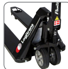
Panther Silent tiene elevación rápida permanente.

También ofrecemos soluciones a medida. Consúltenos para más información o visite nuestra página web www.logitrans.com