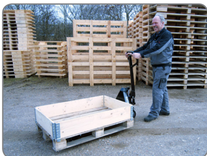
Panther Silent se encarga también del transporte en exteriores.